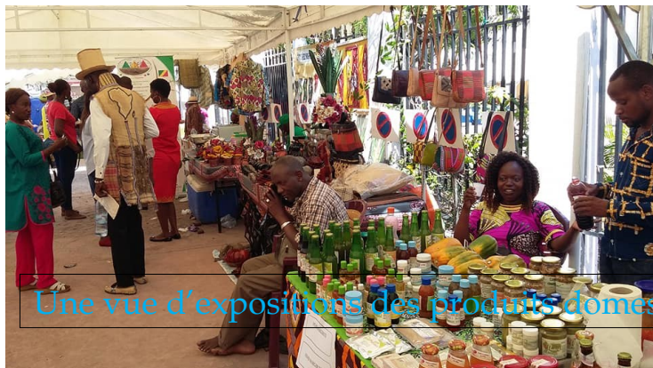
Une vue d'expositions des produits domestiques

L'Exposition et de la Dégustation des produits locaux ont été simultanément organisées les 19 et 20 octobre 2018 à la Chambre Consulaire de Brazzaville.